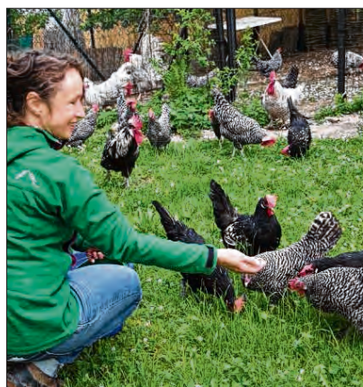
Mit den Krüpern auf Nachbars Streuobstwiese.