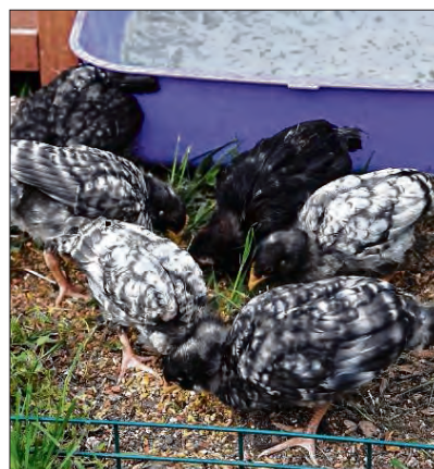
Felicitas (Mitte) und ihre Geschwister dürfen mit nach Wackershofen.